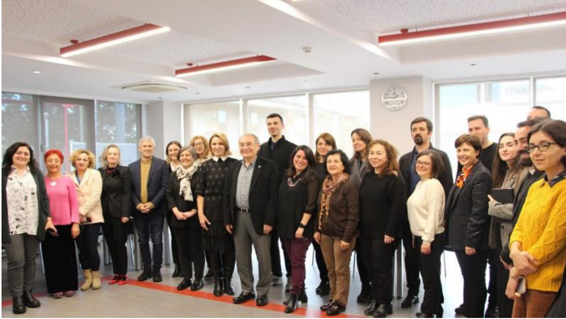
Radyo, Televizyon ve Sinema ile Halkla İlişkiler ve Tanıtım Programı Sunum Süreci

Üsküdar Üniversitesi İletişim Fakültesi'nde Halkla İlişkiler ve Tanıtım programı ile Radyo, Televizyon ve Sinema programı, İletişim Eğitimi Değerlendirme Akreditasyon Kurulu (İLEDAK) tarafından yapılan değerlendirme sonucunda İletişim Araştırmaları Derneği (İLAD) tarafından 5 yıl süreli akreditasyon almaya hak kazandı. Böylece Üsküdar Üniversitesi İletişim Fakültesinde İLAD akreditasyonu almış program sayısı 5'e yükseldi.