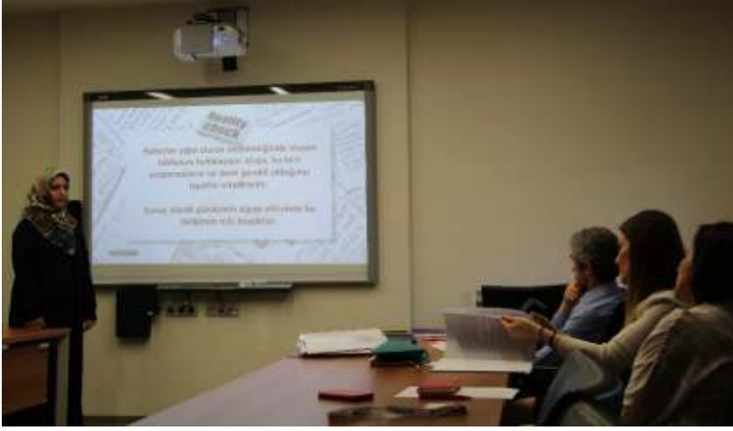
YMG Bölümü 2017-2018 Mezuniyet Tezi Sunumlarından

Bölümler, müfredatları ile ilgili tüm bilgileri fakülte web sitemiz üzerinden paydaşlarımızla paylaşmaktadırlar. Örnek link: https://uskudar.edu.tr/if/tr/sayfa/gorsel-iletisim-tasarimi-dersler